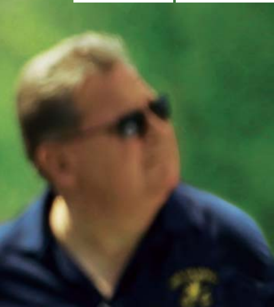
Sergio García, Spanien