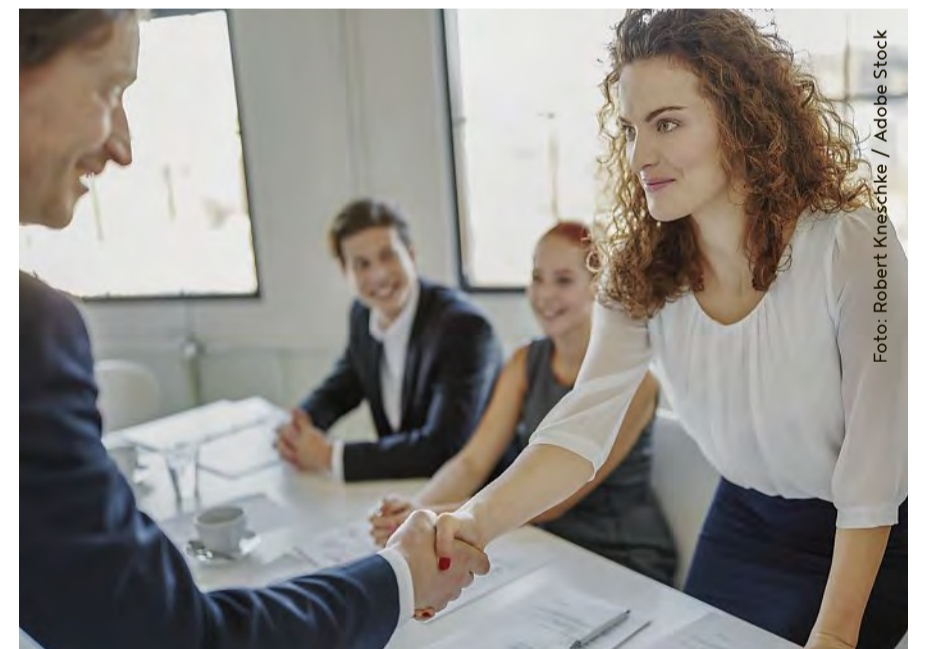
Sie hat es als Quereinsteigerin in das Assessment Center geschafft.

Allerdings zwingt die anhaltende Personalknappheit die öffentlichen Recruiter inzwischen ebenso zum aktiven Personalmarketing wie andere Arbeitgeber auch. In Berufsnetzwerken wie Xing und LinkedIn sind sie ebenso vertreten