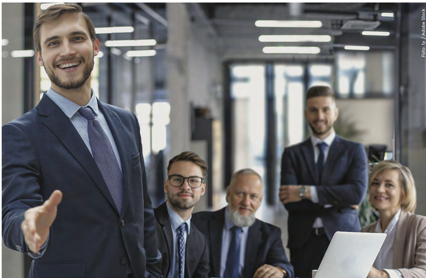
Der öffentliche Dienst will sich runderneuern und breiter aufstellen: moderner, bunter, weiblicher, altersgemischer. Nötig ist's, denn die Bevölkerung ist es ja auch.